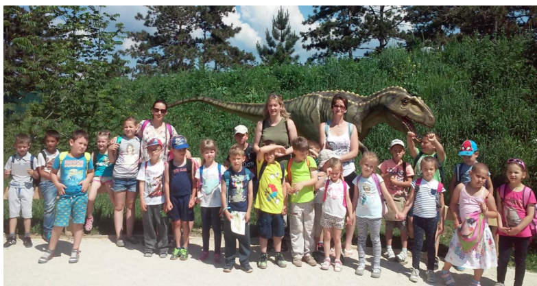
Életre szóló élményekkel gazdagodtak az óvónénik és a gyerekek is Nomádiában

Június 3-án nagycsoportosaink elballagtak. Már reggel izgatottan érkezett minden ballagó nagycsoportos az óvodába. Ebéd után vette kezdetét az ünnepség. Az óvónénik búcsúzó beszédükben az elmúlt 4 év kedves emlékeit idézték fel közösen a gyerekekkel. Majd együtt elfogyasztották a Süni csoport ballagási tortáját, ezt követően videó vetítést néztek a tornateremben, az óvodában töltött évek legszebb emlékeiből. Ezután következett az intézményvezető asszony búcsúbeszéde, melynek végén vállukra vehették a ballagók a tarisznyájukat. Megszeppeven, boldogan vonultak végig az óvoda terméin, udvarán, ahol a kispajtásaitól köszönhettek el. Vállukon tarisznyával, kezükben lufival vonultak végig az utcán egészen az evangélikus templomig. Harangszóra vonultak be a padsorokhoz, ahol már az ünneplő sokaság várta a gyerekeket. Az Istentiszteleten Decmann Tibor tisztelendő úr igeolvasása mellett a gyerekek dalokkal, versekkel búcsúztak az óvodás évektől. A meghatározó, szép családi istentisztelet végén csoportkép készült a ballagókról a templom lépcsőjén.