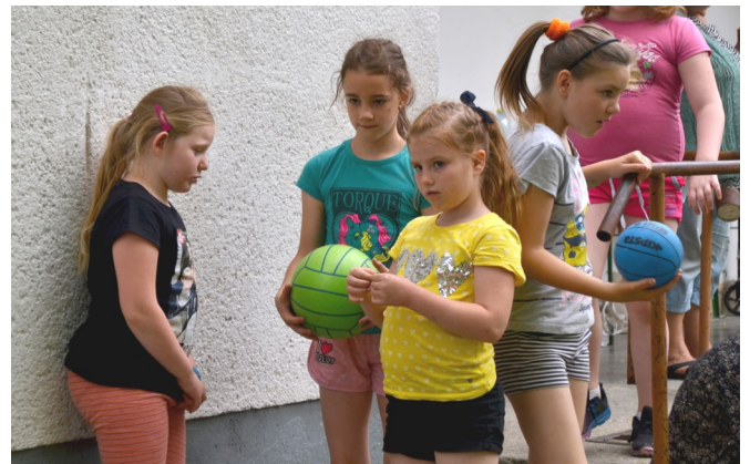
A gyerekek sajnálták, hogy gyorsan elröppent a mozgalmas hét