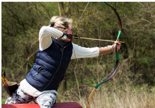
Változatos pozíciókban lőhettek az íjászok

Másnap folytatódott a megmérettetés, ugyanazon a pályán, csak most nappali körülmények mellett. Volt olyan versenyző, aki csak az éjjeli versenyre jött, volt aki csak a nappalira, ám a többség bevállalta mind a két versenyt. Az ötletesen elhelyezett