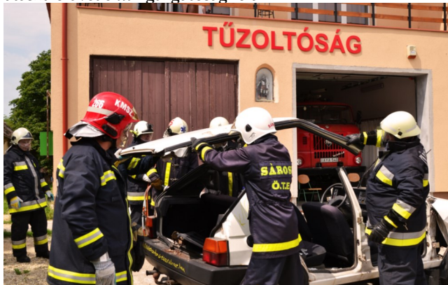
A gyakorlat során egy roncsautót is feldarabolnak a tűzoltók

Cél és feladat volt, hogy a résztvevők a tanult ismereteiket felelevenítsék, kibővítsék, alkalmassá váljanak az önálló tűzoltásvezetői és mentésvezetői feladat ellátására, ismerjék meg a rendszeresített eszközök alkalmazásának szabályait