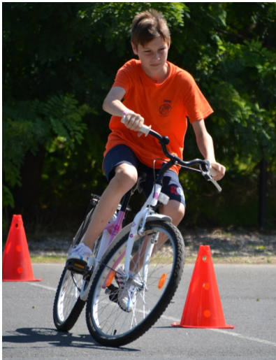
Biciklis akadálypályán ügyeskedtek a gyerekek