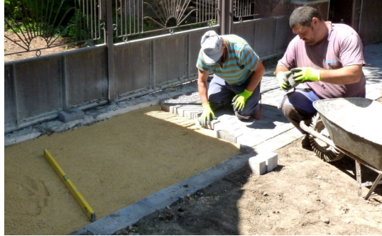
Fontos a precíz és pontos munka

Augusztus első napjaiban az Ozorai utca jobb oldalán kezdődött járdaépítés. A 600 m-es szakasz még augusztusban elkészül, majd megépítik az orvosi rendelő valamint a tűzoltószertár előtti parkolót. A tervek szerint még idén elkezdődik a Jókai utcában is a járdaépítés. Utcánként csak egy oldal épül meg, de így is nagymértékben javul a biztonságos gyalogos forgalom. Az idei év első felében a Dózsa György utcai fóliáknál megépült egy tároló ház ahol az Önkormányzat mezőgazdasági ágazata által termelt termékeket tárolják. Ebben az évben szabadföldeken burgonyát, vöröshagymát, céklát, fűszerpaprikát, mákot, gyöngybabot, sárgarépát, zöltséget, zöldbabot, zöldborsót is termeltek. Az épületben kialakítottak egy szociális vizes blokkot valamint a munkálatokhoz szükséges eszköztárolót is. Az önkormányzat mindkét beruházást önerőből készítette.