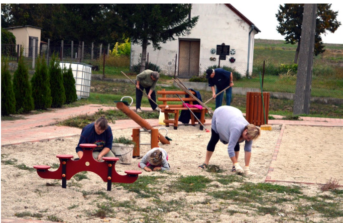
A faluszépítésben nagyon kevés lakos vett részt