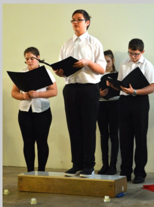
A 8. osztályosok ünnepi műsora méltóképpen tisztelgett a múlt eseményei és hősei előtt.

1956 máig ható példája annak a hősiességnek, amelynek következtében a nemzet újra fel tudott emelkedni létének