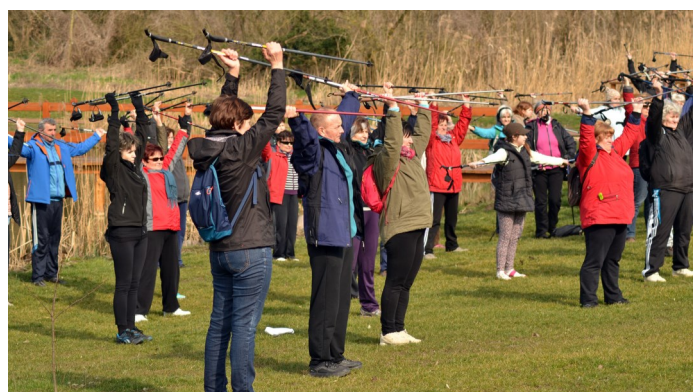
A Nordic Walking sportot sikerült meghonosítani településünkön

Az egészségfejlesztési iroda mai napig is működik, és számos egészséges életre nevelő, valamint életmódformáló programot szervez és támogat az érintett településeken. Önkormányzat