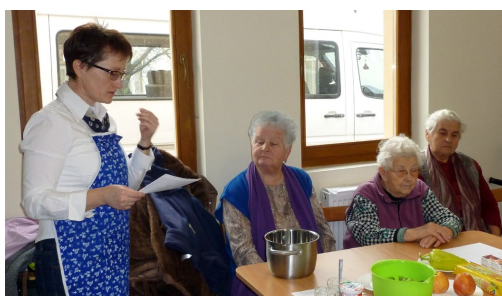
Az önkormányzat tankonyháján egészséges finomságok készültek a helyi nyugdíjas klub tagjainak segítségével