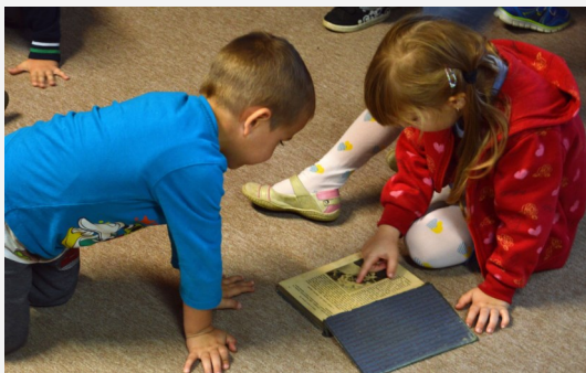
A gyerekek közel 100 éves könyveket is lapozhattak

Lajoskomáromi Könyvtári Információs és Közösségi Hely