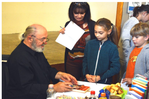
A gyerekeket elvarázsolta az író előadása

gyerekeknek. Arról a gyűjtőmunkáról is hallhattunk, amely megelőzi egy könyv megírását. A közben feltett kérdésekre jól válaszoló gyerekeket pedig kis könyvekkel jutalmazta. A Petepite, a Hogyan neveljünk?, A mi Kinizsink és még sok ismert könyv szerzője örömmel tapasztalta, hogy néhány tanuló olvasta könyveit, érdeklődnek művei iránt. Néhány kulisszatitkot is elárult, például hogy saját fia hogyan alakította önmagát egy filmben, kiről formázta alakjait, melyik a kedvenc könyve, s hogy milyen gyerek volt ő. Nagyon humoros, élményszerű stílussal beszélt a gyerekeknek életéről, az írásról, a könyvszeretetről, könyveiről, filmjeiről, a tanulás és az olvasás fontosságáról. Reméljük ezzel a beszélgetéssel is sikerült felkelteni a gyerekek érdeklődését a könyvek iránt, hogy szabadidejükben olvassanak, ezáltal képzeletük, szókinésük fejlődjön, s új világok nyíljanak meg előttük. A találkozón lehetőség volt rövid személyes beszélgetésre végül dedikálta is saját könyveit.