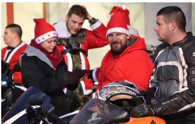
A gyerekek legjobban annak örültek, hogy felülhettek a motorokra

Advent első hétvégéjén motoros mikulások lepték meg a lajosi gyerekeket. Közel 40 motoros érkezett mikulás, és krampusz ruhában a Gyógyszertár udvarára. A motorosok sok csillogó szemű kicsit találtak, akik szüleikkel együtt nagy örömmel fogadták, a szán-helyett, berregő igazi nagy motorokkal érkező motoros mikulásokat. A Mikulás Manói autóval érkeztek, csomagtartójuk teli volt finomságokkal. Sok kisgyermek gyűlt össze, hogy megcsodálja a kétkeréken guruló tálapókat és a motorokat. Közös éneklés után apró ajándékokat, finomságokat osztottak mindenkinek. Ezután ügyességi