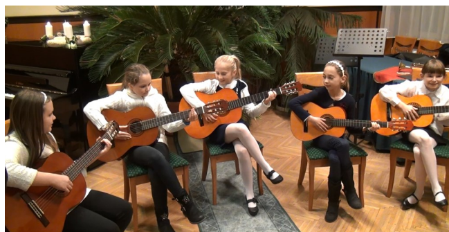
Évről-évre több kisgyermek választja hangszerül a gitárt

Ünnepi koncerttel kedveskedtek a közönségnek a Gesztenyefasori Iskola zenetagozatának növendékei. Fúvós hangszerek, gitár, zongora és az énekkar hangjától volt hangos a Polgármesteri Hivatal díszterme. A koncerten az Zeneiskola elmúlt évi munkájának gyümölcéséből láthatott válogatást a nagydemű. A koncertet az énekkarosok nyitották meg téli dalsokrukkal. Ezután felváltva szerepeltek különböző hangszerekkel a gyerekek. A koncertet - mintegy keretbe foglalva - az énekkar zárta, mai karácsonyi dalok feldolgozásával. A családok szépen