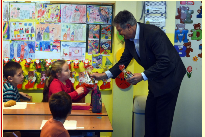
A picik örömmel fogadták a plusz ajándékot

letekkel keltette fel a gyerekek figyelmét a pedagógus. Délután az immár hagyományossá vált Mikulás Kupa Focitorna zajlott, melynek csúcspontja a tanár-diák összecsapás volt. Ezen a napon csupa mosoly és jókedv volt iskolánkban a Diákönkormányzat jóvoltából. Köszönjük! szerkesztőség