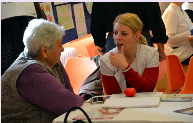
Többen igénybe vették a gyógyszerészeti tanácsadást is