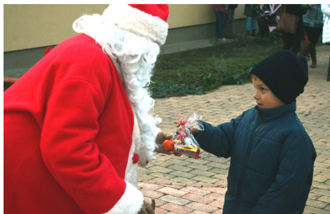
A kicsik csillogó szemmel vették át az ajándékot a Mikulástól