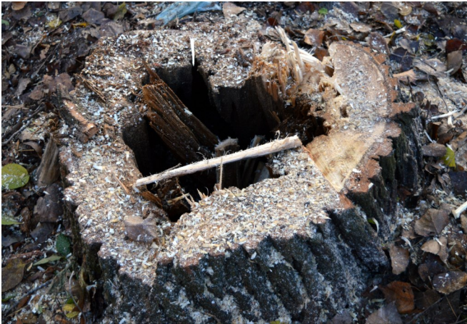
A kivágás után látszott igazán, hogy milyen életveszélyesek voltak valójában ezek a fák.