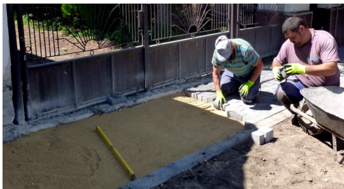
Az első lépcsőben az Ozorai és a Jókai utcában készültek el a járdák

Sportegyesületünk az elmúlt évben is igen aktív volt. Utánpótláskorú csapataink nevelése kiemelt feladat volt a tavalyi esztendőben is. A Társasági Adó felajánlásból több mint 15 millió Ft-ot sikerült összegyűjtenünk a helyi vállalkozásoktól - Győ-