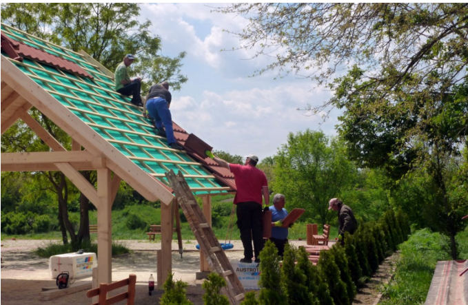
Középogárdon is számos fejlesztés történt az elmúlt évben

Számos EU-s pályázatot nyújtottunk be az elmúlt év során kizárólagosan önkormányzatok számára kiírt területeken. Ezek közé tartozik az önkormányzati intézmények biomasszával történő fűtése projekt, egy ipari park létrehozása a Malomközben, valamint a Művelődési Ház felújítására. A három projekt összértéke meghaladja a 300 millió forintot. Sajnálatos módon, ezeket a pályázatokat még nem bírálták el.