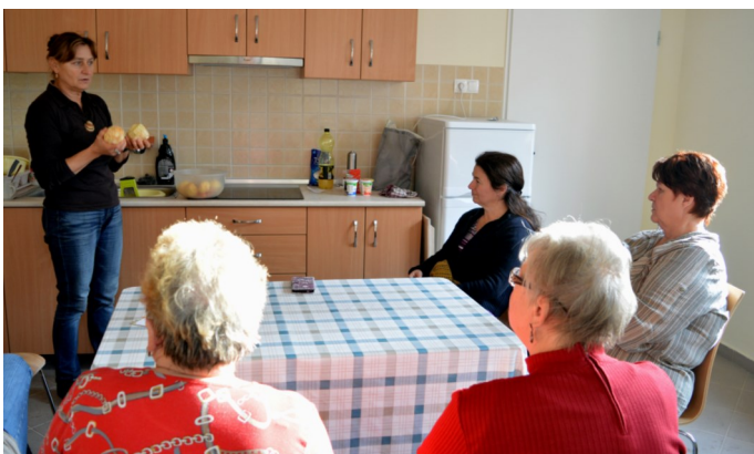
A Főzőklubban egészséges ételeket, elkészítési módokat ismerhetnek meg a háziasszonyok