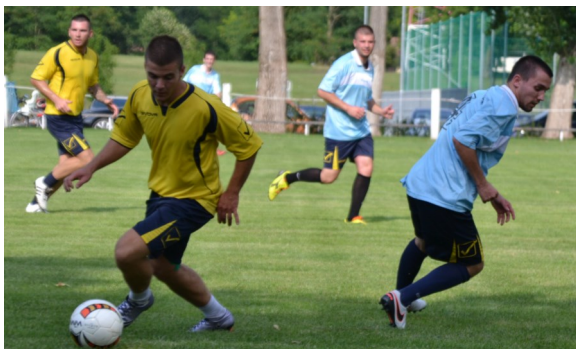
Sportolónk télen is versenyeznek a környékbeli tornákon