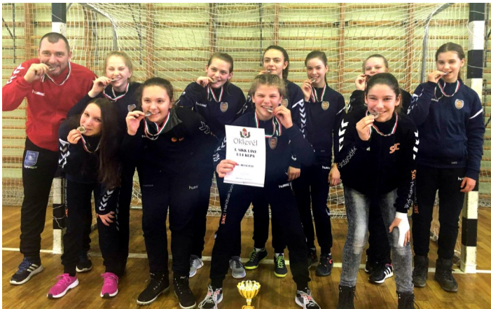
A sok lelkiismeretes munka mindkét részről meghozza gyümölcsét

Délután 14.00 órakor Siklós csapatával küzdöttek meg, és 21-17-es győzelemmel tették fel a koronát a napi teljesítményükre.