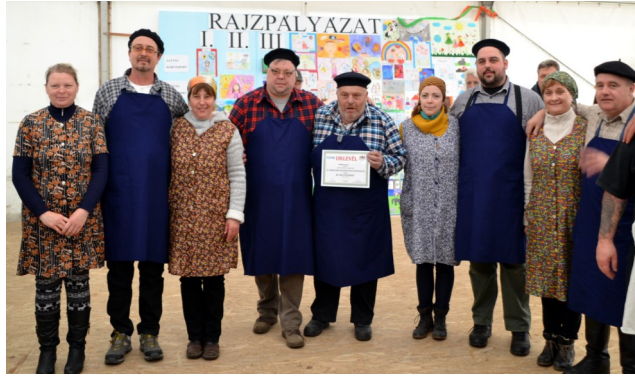
A lajoskomáromi csapat a verseny kolbász ízét káposztával tette különlegessé

A Mozdulj a Városért Egyesület idén is Rétimajorban rendezte a IX. Kolbásztöltő Fesztivált. Tizennyolc csapat jelentkezett a megmérettetésre. Találkozhattunk már évek óta megszokott csapatokkal, de első alkalommal érkeztek baráti társaságok Baranya megyéből, Tolna megyéből és Komárnoból is. A csapatok bemutatkozása közben a versenyzők nekiláttak a különleges ízesítésű kolbászhúsok bekeverésének. Készült káposztás-, aszalt szilvás-, krumplis kolbász, de a többség hagyományos ízekkel kombinált. A zsűri elvegyült az asztalok között, a bekevert anyagokat kóstolgatták és egyidejűleg pontozták a csapatok által elkészített asztaldecorációkat is. A sorrend felállítása után a Vidám Színpad művészei szórakoztatták a közönséget. A zsűri döntése alapján a verseny harmadik helyezette Lajoskomárom csapata, második helyezett a Mágocsi böllérek csapata, első helyezett Tinód Gyöngyei. A legszebb asztal díját a Sárhatvani csapat hozta el. A jókedv idén sem hiányzott a kolbásztöltés ideje alatt, zenés produkciók szórakoztatták a résztvevőket és a csapatok szurkolóit. A mulatság késő délutánig tartott. t. szerkesztőség