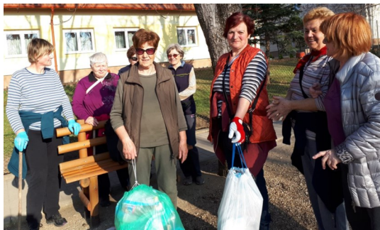
Már pénteken elkezdődött a település megtisztítása...

Éppen az egyik ilyen helyen szedtem én is a rengeteg szemetet, amikor egy anyuka jött arra az alig 3-4 éves gyermekével. Hallottam, amikor a pici odasúgta a mamájának: - „A néni szedi a szemetet.” - Igen! Talán pont ezekkel a kicsikkel kéne kezdeni már otthon is a környezettudatos nevelést, és elmondani, hogy mi okból is szedi a néni a szemetet, és miért fontos ez.