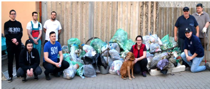
Két nap alatt közel ötven zsák szemetet sikerült összegyűjteni a maroknyi csapatnak