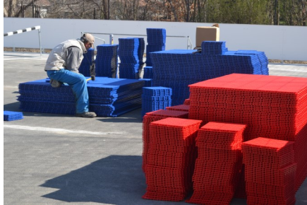
Rekortán burkolat: helyszínen öntött, gumi-granulátumból és poliuretánból készült burkolat

A Magyar Kézilabda Szövetség kültéri kézilabda pályák építésére indított országos programjának keretében Lajoskomáromban kültéri kézilabda pálya kerül megvalósításra, 31 millió Ft értékben. A szabványos, 22x42 méteres pálya köré palánkot és labdafogó hálót is kialakítanak. A projekt keretében a tornaterem mögött található betonos kézilabda pálya kerül felújításra. A kiépítésre ke-