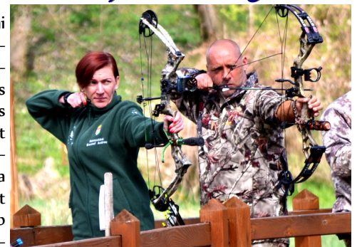
A szervezők furfangos célpontokkal, és feladatmegoldásokkal készültek

A Lajoskomáromi Íjász Sportegyesület április 6-án immár hagyományos módon tréfás örömjász versenyt rendezett. Az időjárás kegyes volt a sportolókhoz, mert bár az előző nap megérkezett a várva várt eső, szombaton verőfényes napsütés volt. A reggeli hűvös időt meleg kávéval, teával és egyéb melegítő italokkal kompenzálták a versenyzők. Az ország minden részéről érkeztek íjászok az Akácligetbe. 110 nevező, és közel 30 fő kísérő vágott neki a 24 furfangos feladat megoldásához. A versenyzők a Lajoskomáromi környezetet is megcsodálhatták; a Majális térről leereszkedtek a Béka-tóhoz, majd innen a Fürdőig sétáltak az erdőben. Enyhe emelkedőn kaptattak fel, majd a foci pályá alatti szőlők között vitt az útjuk vissza a kiindulási pontra. Késő délután érkeztek vissza fáradtan, éhesen a résztvevők. A LISE tagjai finom bográcsos étellel vártak mindenkit. A verseny nagyon jó hangulatban zajlott, a végére mindenki sok élménnyel lett gazdagabb. Köszönjük az Íjász Egyesület minden tagjának, hogy rendezvényeikkel falunk jó hírnevét öregbítik!