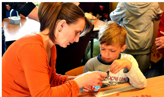
A szülők örömmel oldották meg gyermekükkel a kreatív feladatokat