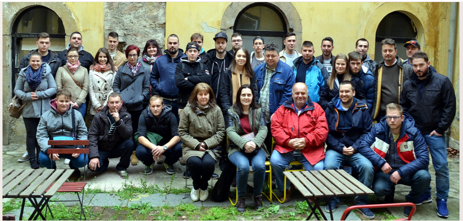
A szabaduló szobában jó stratégiaként rekord idő alatt oldotta meg a csapat a feladatokat

Ezután visszatértünk Budára, mégpedig a Millenáris volt a következő állomásunk. Részt vettünk a Láthatatlan Kiállításon, ahol vakok vagy látássérültek kísérték minket el egy olyan útra, ami számunkra, látók számára egy különleges és figyelemfelkeltő élmény volt. A Láthatatlan Kiállítás Budapest egy különleges, interaktív utazás egy láthatatlan világba, ahol teljes sötétségben próbálhatsz meg eligazodni csupán a tapintás, a hangok és az illatok nyomán. Mielőtt elindultunk volna a különleges túrára, megismerhettük a Braille-írást és a Braille-írógépet. Az első szobában egy konyha és egy előszoba fogadott minket, ezután egy úttestet imitáltak számunkra, amelyen átkelve egy zöldészeshez értünk, kitapogathattuk a zöldségeket és gyümölcsöket a pulton. Ebben a szobában még várt minket egy parkoló autó, melynek a megtalálása kissé nehézkes volt, hiszen el kellett hagynunk az addig utat mutató falakat. Ebből a szobából kilépve egy vadászházba