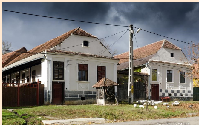
Besztercétől 24-km-re délnyugati irányban, egy katlanszerű mélyedésben fekszik Zselyk falu

Nekem személy szerint a gyerekkoromat idéző csendes falusi idill, kultúrház színpaddal, templomba igyekvő fejkendős néikkel, kalapos bácsikkal, házak előtt totyogó, csipegető libacsapattal, téli lovas szánkózással, vagy a kemencében sült kenyérral. Az, hogy ott két éve még térerő sem létezett, nekünk áldás volt, de az ott élők ez által még inkább elszigetelődtek a valóságtól, a segítség is nehezebben jutott el oda, ha szükségük volt rá. A hétvégeken hazajáró családtagok rendszeres támogatására szorulva éltek mindennapjaikat. Ma már van térerő is és aszfaltozott út vezet a faluba.