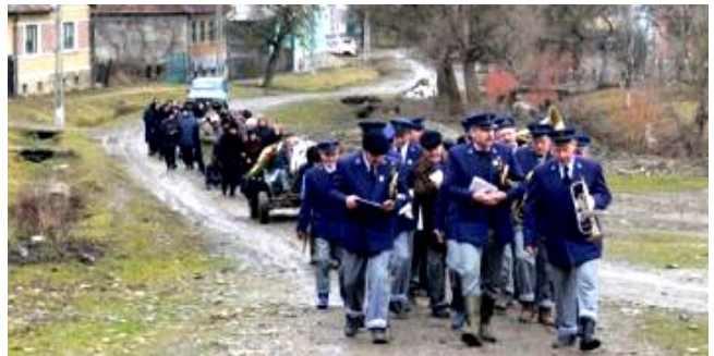
A zenekar alapítói túlnyomó részben „nemesek” voltak.

Úgy kezdődött, hogy akkoriban egy másik szász falu fúvósai játszottak Zselyken. Ekkor született meg az gondolat nyolc ember fejében, hogy talán nekik is ki kellene próbálni. Azóta fújják,- 1945-öt kivéve- megállás nélkül. A két világháború