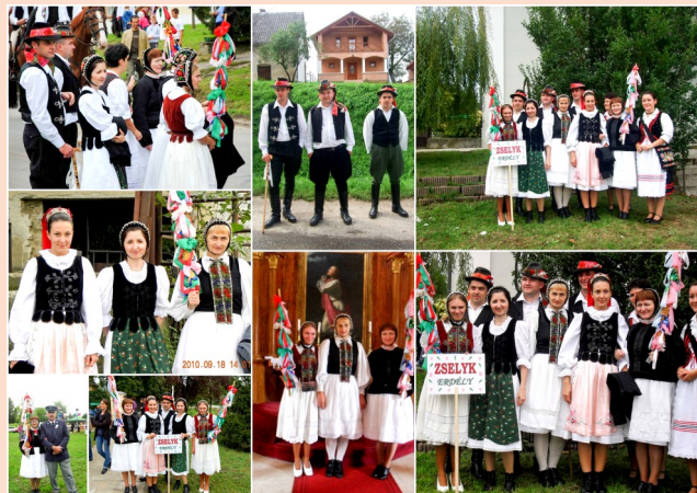
A mezőszegi viselet egyik fő jellemvonása az élénk színek kerülése

A nők öltözeté fehér gyolcsing nyakra gombolós gallérral, fodros kézelővel. Az ingre vették fel a mellényt, vagy más néven lájbit, amely fekete vagy piros bársonyból készült a derekán fodorral. A lájbit gyöngyökkel, zsinórokkal díszítették. A fejre gyöngyös párta került, melyet színes szalaggal tűztek fel. A fiatalasszonyok ünnepeken főkötőt, vagy fiketőt hordtak a fejükön, melyet szorosra