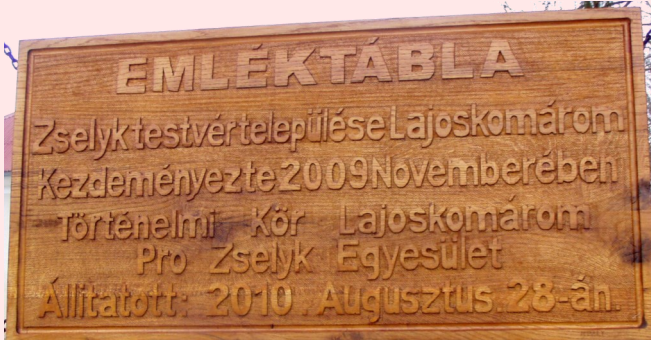
2010. 08. 29-én avattuk fel az Evangélikus templom előtti emléktáblát

Az idei augusztusi ZSELYKI NAPOKON gazdag program várta az oda érkezőket. Voltak ott Pestről, a környező településekről, Kolozsvárról, valamint Lajoskomáromból is. Tőlünk közel 35-en érkeztek a rendezvényre, köztük az Evangélikus Rézfúvós Zenekar tagjai is.