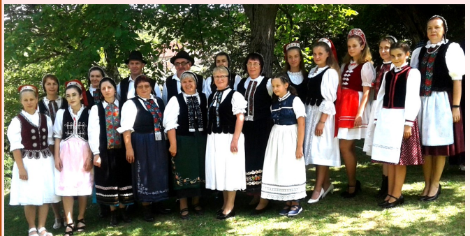
Nyíltszívű, őszinte, vendégszerető emberek a mezőszéki falu lakói