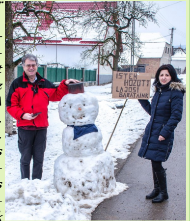
A hóember is igazolja; mindig visszavárlak Zselykre

„Nekem a lajosi barátság, egy nagyon sok szeretettel teli barátságot jelent. Szavakban nehéz kimondani, kifejezni. A barátságunk ott van, ahol együtt vagyunk. Viszontvárlak titeket is hozzánk, mindig szívesen megyek hozzátok és szívesen találkozom veletek a világ bármelyik sarkában. Ezt, hogy mindig visszavárlak Zselykre a hóember is igazolja!"