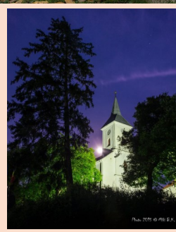
Puskás Tiborné Ági