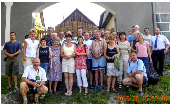
Megható, hogy mennyi szeretet lakozik a mai határokon túl élő emberek szívében hazájuk iránt

Az ősi - XIII századi Zselyk és a XIX. századi fiatalabb testvére Lajoskomárom között működött a kémia, rövid idő alatt több családi és baráti kapcsolat alakult ki. Ránk nagy hatást gyakorolt a minden nehézségen felülkerekedő szülőföld, anyanyelv iránti hűség és szeretet. Talán időben érkeztünk, a fiatalok újult erővel tértek haza, sokszor hétvégén.