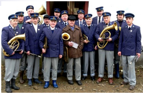
A zselyki fúvószenekar 1879-ben alakult

Mivel a régi időkben a szász falvak fúvósai ünnepi alkalmakkor a templomuk tornyában zenéltek, ezért tornyosoknak, szászul turnereknek nevezték őket.