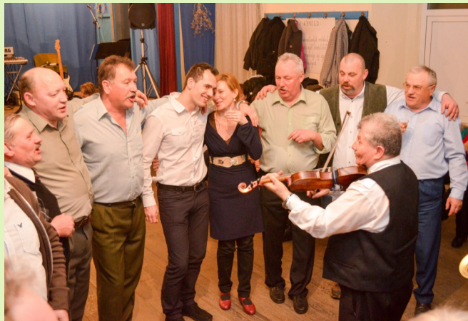
Mezőség régies, de gazdag és fejlett tánc- és zenekultúrája több tényező együtthasárának köszönhető

„A távolság ellenére a nemzet együtt érez. Gyakorlati-