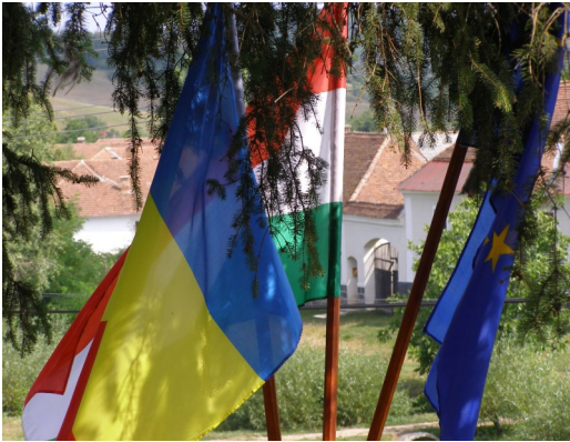
Zselyk, az élni akaró mezősegi falu.