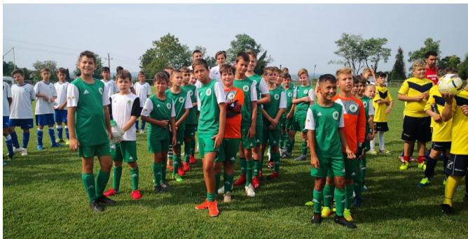
Tíz egyesület korosztályos csapatai mutathatták be tudásukat