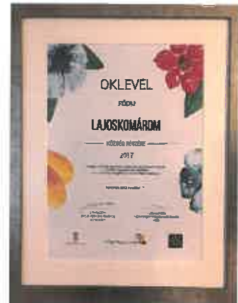
Pirtyák Zsolt Lajoskomárom polgármestere