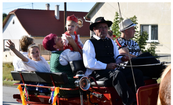
Sok új lépést, koreográfiát tanultak az év során a gyerekek

get. Köszönjük a szervezők és a résztvevők megfeszített munkáját, valamint minden támogatónak a felajánlást. szerk.