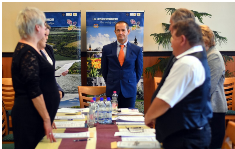
A polgármesterrel együtt hét helyi képviselő dönt a következő öt esztendőben a Lajoskomáromi ügyekről