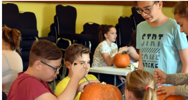
A szorgos kezek 50 töknek faragtak rémisztő arccokat