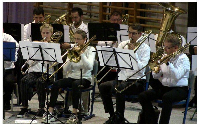
Közel ötven rezes remegtette meg a tornatermet