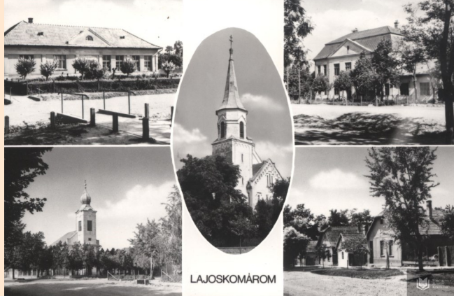
Legyen jó érzés itt lakni!

sokat szenvedtek, nélkülöztek, és sújtotta őket különböző csapás, de aki itt maradt, az tevékenyen hozzájárult ahhoz, hogy ez a falu ma is így nézzen ki. Erre büszkék is vagyunk! Biztos voltak olyanok, és nem csak én, akik átélhették már azt az érzést, mikor jött egy idegen, barát, vendég és rácsodálkozott arra, hogy milyen szép település a miénk. No, akkor dagadt a mellünk! Büszkék vagyunk a gesztenyefasorra, a pincesorra, a rendezett portákra, utcákra. Idézzük Vas Gerebentől: „az első rendes falu”. Elmeséljük, hogy itt volt az országban a második tőzsde. Az istállót téglából építették, mert „az hozta a pénzt”, a lakóházat csak később építették át téglával, mert első volt a gazdaság, és csak utána a kénye-