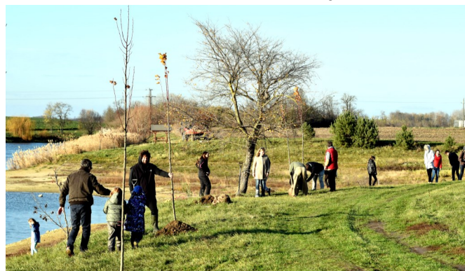
A metsző hideg szél ellenére a kicsi lelkes csapat kitartott...

a polgármester úr, hoztak vödörket, lapátokat, és megérkeztek a fák is. Azok közül az emberek közül, akik fizettek a fákért, sokan jelezték, hogy ha alkalmas lesz az időpont, eljönnek az ültetésre is, de végül csak 10 felnőtt és 8 gyerek jött el ténylegesen. Ennek hátterében egy kis kommunikációs félreértés lehetett, mert én úgy értettem, hogy alapvetően az önkormányzat szervezi az ültetés konkrét folyamatát, és mi adományozók csak besegítünk, de kiderült, hogy alapvetően ránk számítottak az ültetésben, más embert nem hívtak, ezért végül nem voltunk elegenden mind a 130 fa egy délután alatti elültetéséhez (ennyi fára gyűlt össze az adomány). Így is sikerült kemény munkával kb. 50 fát elültetnünk délután 2 és 5 óra között, tovább nem tudtuk folytatni, mert besötétedett. A polgármester úr végig ültetett velünk együtt, egy másik úr segített egy traktorral szállítani a fákat, és jelen volt egy hölgy is, aki meleg teát és ennivalót is hozott nekünk. Nagyon élveztük a munkát, gyönyörű idő volt szerencsére. A gyerekek is aktívan kivették a részüket a munkából, vizet hordtak, sőt még ástak is.