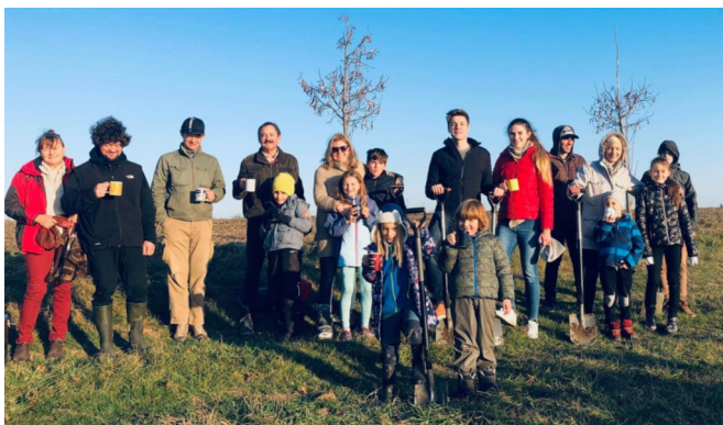
Mi, egyszerű emberek is sokat tudunk tenni a környezetünkért

Tudom, hogy idén nyáron kellett a tagállamoknak bemutatniuk az EU-nak azon stratégiájukat, hogy 2021 és 2030 között milyen célok teljesítését vállalják a klímavédelem érdekében, és tudom, hogy más országokkal együtt Magyarországot is kritika érte, amiért nem vállalt az EU elvárásának megfelelő értékeket az energiahatékonyság növelése és a megújuló energia részarányának növelése érdekében. Tisztában vagyok azzal is, hogy ezen elvárások teljesítésének, a gazdaság átalakításának komoly költségei vannak, amit elő kell teremteni, és a vita leginkább ezen folyik, de úgy érzem, miközben a nagypolitika ezzel foglalkozik, mi állampolgárok egyéni szinten sokat tehetünk a saját környezetünkben a helyzet jobbításáért. Mi például elektromos autót használunk, szelektíven gyűjtjük a szemetet, próbáljuk csökkenteni a fogyasztásunkat, nem vásárolni felesleges dolgokat, saját szatyorral menni a boltba, és minde mellett most elkezdtünk fákat is ültetni. Szerintem alapvetően fontos, hogy az emberek ne mindig felülről, a politikusoktól várják a problémák megoldását, hanem maguk is cselekedjenek.