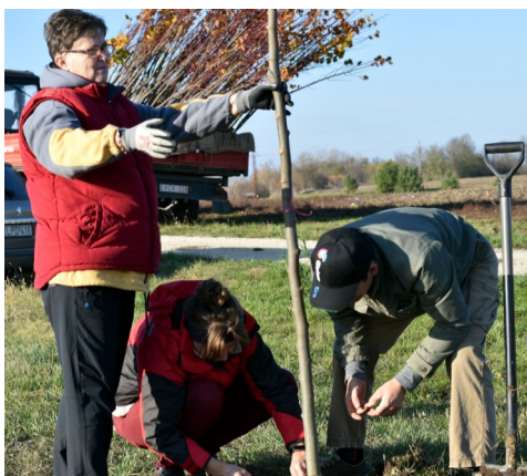
Az első fák a polgármester és a képviselőszószony vezetésével kerültek helyükre

A nagyobbik fiam épp most lett 9 éves, hetekkel ezelőtt megszerveztük november 23. szombat délelőttre a születésnap