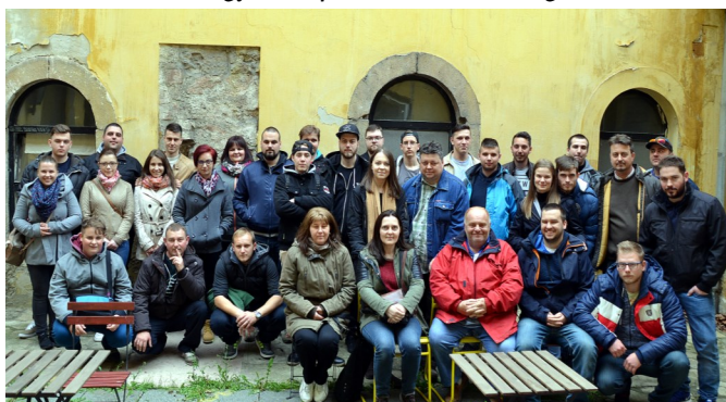
A 2017-es kiránduláson a LIKE tagok létszáma még közel 40 fő volt

2018. november – Budapesti kirándulás – Egyesületünk felajánlotta az általános iskola részére egyik kirándulását, így az iskola életében nagy szerepet betöltő DÖK tagok elmehettek