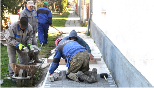
Ebben az évben is folytatódik a járdaéptés falunkban

kötelezően kapcsolódó elemként gyümölcsös létesítésére - nyert támogatást az Önkormányzat. A pályázat megvalósításával a Fülöp-hegy É-Ny-i (Róka-tanya alatti) útszakasza kerül megtisztításra, köves-kavicsos burkolatot kap, amivel a Fülöp-hegy körbejárhatóvá válik.