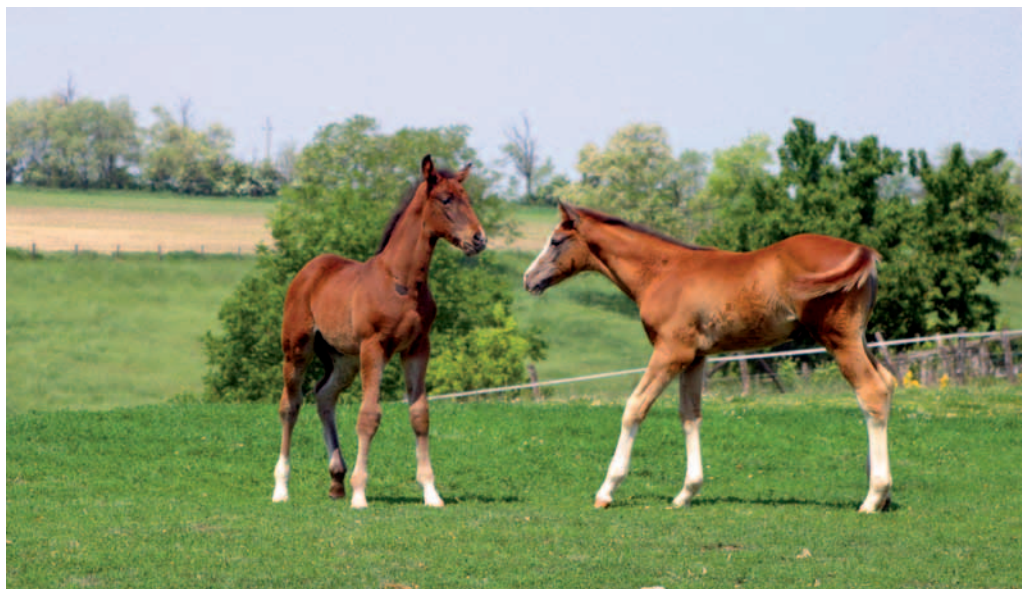
Ustinov és Lupicor apaságú csikók , a jövő generációját képviselik Sáripusztán

Visszatérve az én történetemhez, 1960-ban bevonultam katonának. Mikor leszereltem 1963-ban, az akkori vezető Gadácsi „kartárs” behívatott, hogy gondoljam meg, visszamegyek-e a lovak mellé, mert szeretné, ha elmennék inkább traktoros iskolába. Ez a hatvanas évek elején tipikus karrier lehetett volna számomra. Sokat nem gondolkodtam az ajánlatán, úgy döntöttem, nem megyek traktorosnak, inkább maradok a lovak mellett. Pedig a lovak sorsa akkorra már megpecsételődött. Éreztették is velem, hogy átkerültem a vesztes oldalra, hiszen mikor a lovak körül bármire szükség lett volna,