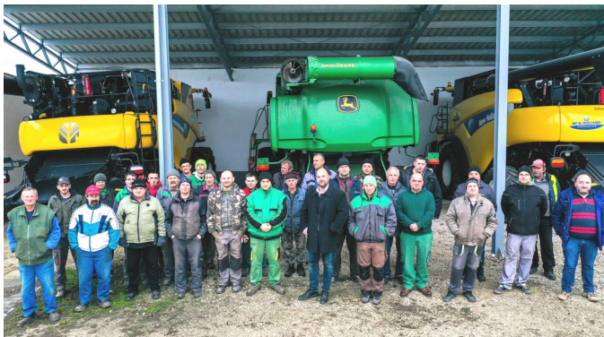
Elsődleges célunk a cég fenntartása, a munkaerő megtartása, ennek érdekében dolgozunk nap mint nap

A cégcsoportunk 3100 hektár területen gazdálkodik. E fölött van még 2000 hektár teljes körű bérmunka, amiről a haszon nem a miénk, de a szellemi és a fizikai munkát mi végezzük. Ezenkívül van még 3000 hektár részleges bérmunka, amibe szellemileg nem folyunk bele, csak a megrendelt munkafolyamatokat végezzük el. A dolgozók létszáma 90 fő. Vannak még alkalmi munkavállalóink is, olyan gazdák akikkel együtt dolgozunk. Fő növényeink a gabona - búza, árpa, kukorica - Tavalyelőtt és tavaly is a Mogyi Kft. legfőbb napraforgó beszállítói voltunk. Most egy kicsit visszaesett a területünk a bizonytalan vetőmag előállítás miatt, de a helyét átvette az olajos napraforgó. Speciális növényünk a hibrid kukorica. A Pioneer cég számára állí-