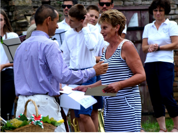
„Virágos Lajoskomáromért „ verseny díjait 20 előkert tulajdonos vehette át.

vényt megnyitotta a kisbíró és a polgármester. A helyszínen az Evangélikus Rézfúvós Zenekar műsorát hallhattuk.