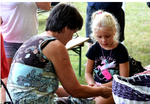
A helyi kézművesek termékeikkel színesítették a fesztivál kínálatát

Erre az alkalomra településünk ügyes kezű kézműveseit is meghívtuk, megadva a lehetőséget termékeik bemutatására, népszerűsítésére. 15 helyi őstermelő és kézműves állította fel asztalát a borospincék mellett, és mutatta be portékáját a pincesoron vonuló látogatóknak. A vállalkozó kedvű vendégek hímes tojást festhettek, kipróbálhatták a pirogravírozást, helyi füstölt árut, sajtot, mézet, lekvárt, szörpöt kóstolhattak.