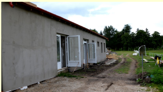
A játékos szám növekedés miatt szükségessé vált az öltöző bővítése

A jövőben is szeretnénk élni a pályázat adta lehetőségekkel, hiszen ennek célja, hogy minél több amatőr futballista, minél jobb körülmények között játszhassa a világ legnépszerűbb játékát.