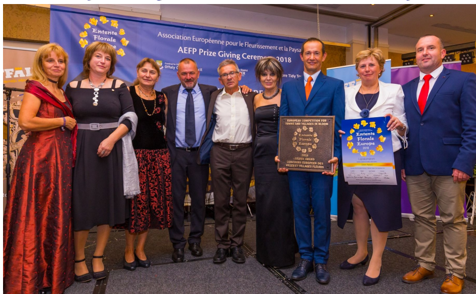
Falunkból 8 tagú küldöttség érkezett a díjkiosztó ünnepségre