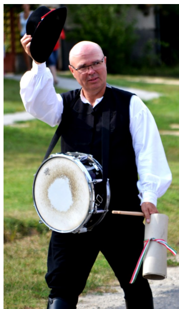
A menet a kisbíró vezényletével indult a Fülöp - hegyre

A mazsorették és fúvósok vezetésével gyalogosan indultak a felvonulók a fesztivál helyszínére. A menetben, a település lakói mellett a falu elöljárói, a képviselőtestület tagjai, a csóka-