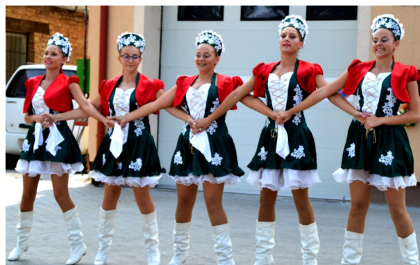
A kislángi Happy Girls mazsorett csoport megalapozta a fesztivál jó hangulatát

Ebben az évben sajnos a Székelyudvarhelyi huszárok nem tudtak eljönni rendezvényünkre, ezért a kisbíró nem járta körbe a falut hintóval. A Tűzoltószertár előtt, rövid megnyitó műsorokkal várták a fesztiválozókat, akik sajnos igen csekély