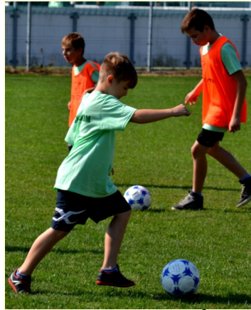
Az őszi szezon Bozsik tornái is elkezdődtek

A jövőben is szeretnénk élni a pályázat adta lehetőségekkel, hiszen ennek célja, hogy minél több amatőr futballista, minél jobb körülmények között játszhassa a világ legnépszerűbb játékát.