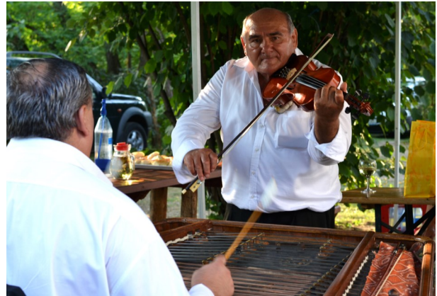
A több helyszínen hallható színvonalas zene is hozzájárult a rendezvény sikeréhez

A rendezvény sikerrel zárult, közel ezer látogató fordult meg településünkön, az ünnepi hétvégén, ebből nagyon sok