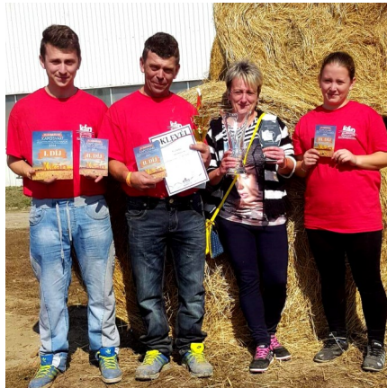
Az egész család az állatokkal foglalkozik

Vannak, akik benne vannak, és vannak, akik nincsenek. Ezt csak szívet-lélekkel lehet csinálni. Igen, mentek rá barátságok. Úgy gondolom, hogy aki ebben nincs benn, az nem értheti azt, hogy én miért rajongok érte ennyire. Én kiskorom óta állatok között élek. Belém rögzült, hogy mindig van tennivaló körülöttem. Az általános iskolás osztálytársaim ezt nem értették meg, lekezelően álltak ezekhez a dolgokhoz, a gimnáziumi osztálytársaim érdeklődtek. Érdekesnek találták a szarvasmarha show-k világát. A gimis tanáraink is nagyon pozitívan álltak ezekhez a dolgokhoz. Rácsodálkoztak, hogy van még olyan fiatal aki szenvedéllyel és kitartással végez egy számára fontos feladatot. Itt kaptam negatívot, ott kaptam pozitívot, és ebből gyúrtam magamnak egy mottót; Aki azt mondja, hogy ez nekem jó, vagy örül az én sikereimnek, annak én örülök, aki meg nem, hát az nem. Én ezt így fogtam fel.