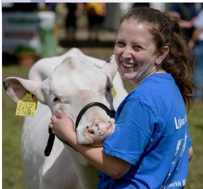
Soha nem éreztem tehernek az állatokkal való foglalkozást

- Talán az a furcsa a te korodban, hogy van valami célod, és ilyen szinten foglalkozol valamivel. A legtöbb fiatal annyira el van veszve ebben a világban és annyira nem találja a helyét, hogy közöttük te különleges vagy.