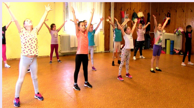
A lányok lelkesen és szorgalmasan készültek a bemutatóra