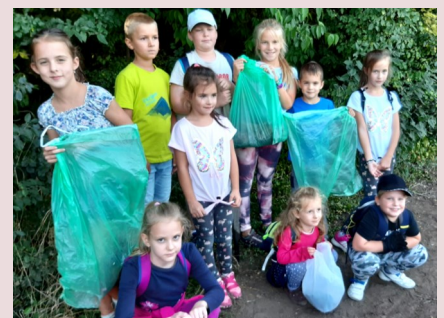
Fontos környezettudatos magatartás kialakítása,