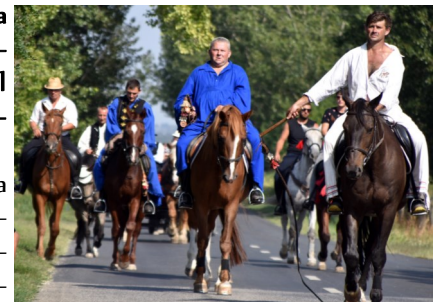
Hangos ostorpattogtatás jelezte a menet közeledtét