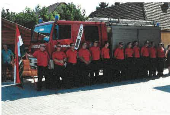
Pirtyák Zsolt Lajoskomárom polgármestere