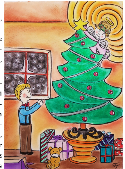
Fodor Tünde illusztrációja

kacagást hallottam. Aranylő-ezüstös fehér fényben megjelent ő, a Pihe-puha Hópihe kisangyal. Varázsport szórt a fenyőre, amitől a fa ágai tündöklően szikrázó táncot lejtettek, az üveggömbök pedig gyengéden egymáshoz koccanva adták az ütemet. Azaz csak csilingeltek volna, mert meglepetésemre leestem az asztalról, és magamra borítottam az egész feldíszített fát. A nagy csörömpölésre befutottak a többiek. Én ott feküdtem a padlón, a felborult karácsonyfa alatt. Körülöttem a sok törött dísz, üvegszilánk, és a bosszankodó, mérges arcok. "Neveletlen kölyök, mit csináltál? Lerántottad a karácsonyfát. Tudod te, hogy most mekkora kárt tettél?" szidott apa. "Szégyellj magad! Tönkretetted az ünnepet. Irány, állj a sarokba büntetésből, és hátra ne fordulj, amíg nem hívlak!" korholt anyja, és gorombán a szoba sarkába penderített. "De én csak az angyalt szerettem volna megfogni..." szabadkozott, de látva a többiek vádló tekintetét, inkább elhallgattam.