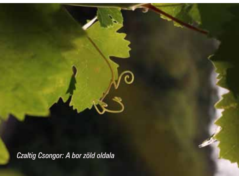
Czaltig Csongor: A bor zöld oldala