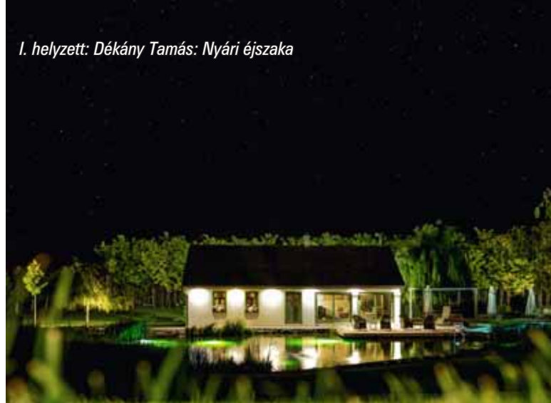
I. helyezett: Dékány Tamás: Nyári éjszaka