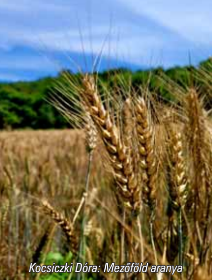
Kocsiczki Dóra: Mezőföld aranya