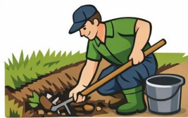
Tisztítás és karbantartás

Az átereszt könnyedén eldugulhattak az ősszel lehullott falevelektől, az elmúlt időszakban letört faágaktól, sártól, törmeléktől, és így a vízelvezető-rendszerek nem tudják betölteni funkciójukat. Ha eddig még nem tették, ebben a napsütésben időszakban lesz rá lehetőség, hogy a ház előtt a vízelvezető árkokat kitakarítsák!